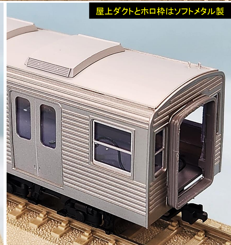
屋上ダクトとホロ枠はソフトメタル製