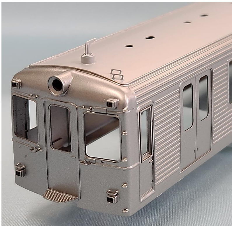
特徴の一つヒューズ箱からの横配管